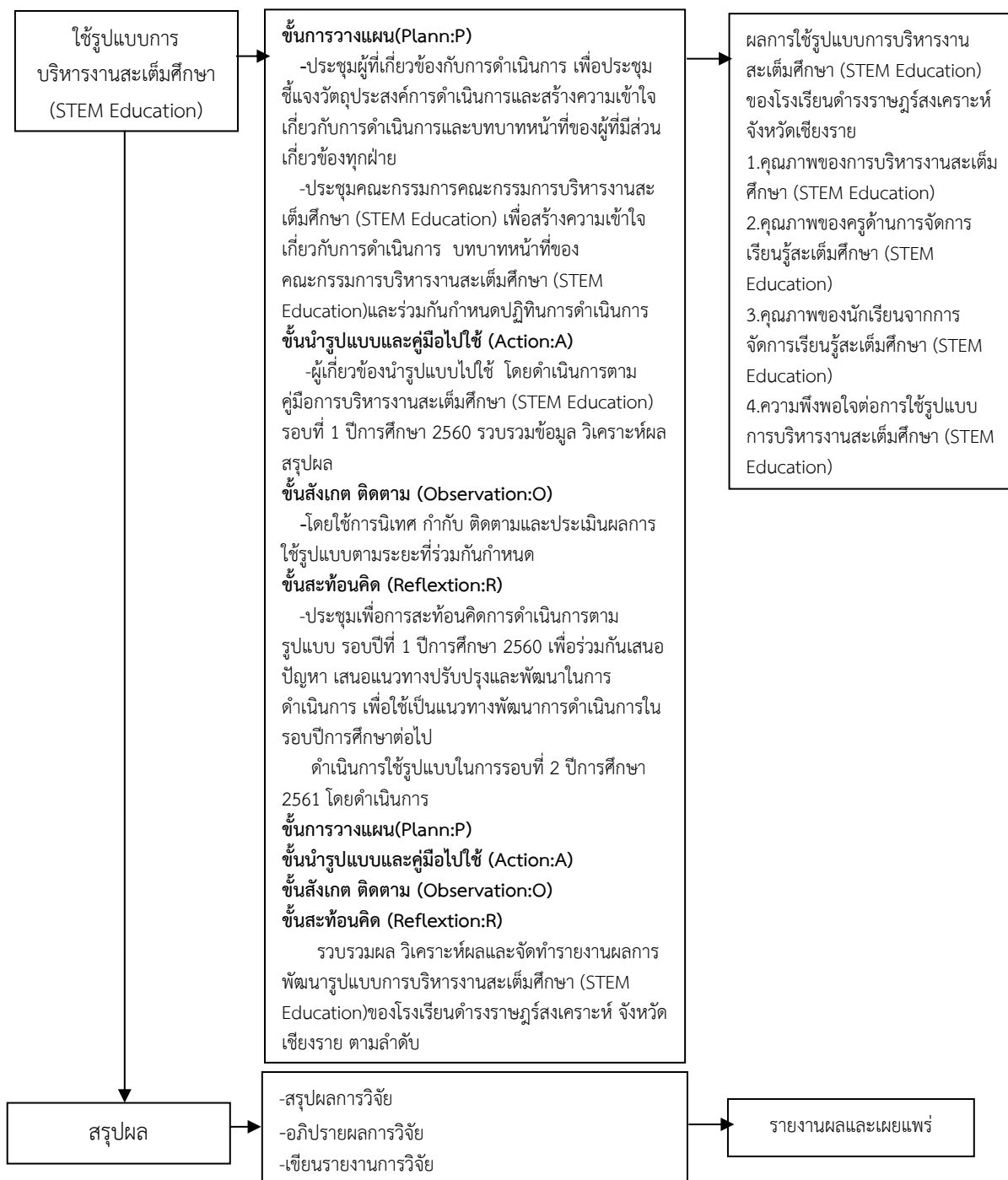
แผนภูมิ 3.1 ขั้นตอนการดำเนินวิจัยการพัฒนาแบบการบริหารงานสะเต็มศึกษาของโรงเรียนดำรงราษฎร์สงเคราะห์ จังหวัดเชียงราย

(ต่อ) ขั้นตอนดำเนินการวิจัย ประเด็นที่ต้องการ